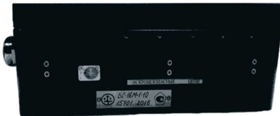
Рисунок 1 - Внешний вид блока согласующего БС-16М